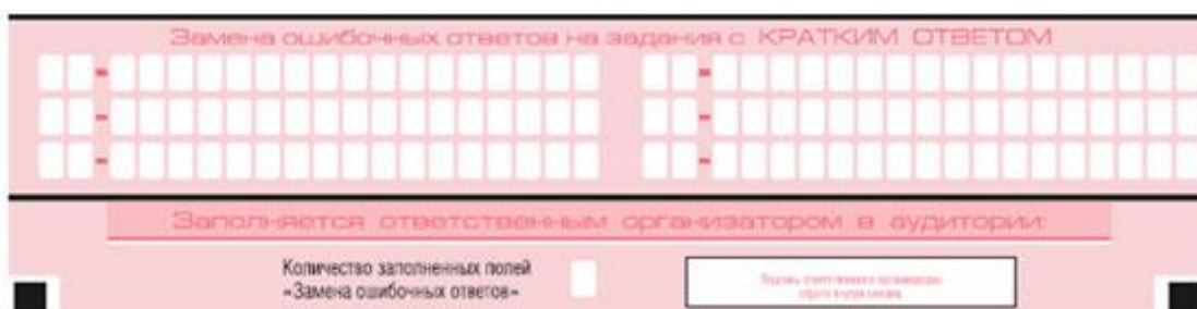
Рис. 9. Область замены ошибочных ответов на задание кратким ответом

Запрещается записывать ответ в виде математического выражения или формулы. В ответе не указываются названия единиц измерения (градусы, проценты, метры, тонны и т.д.) – так как они не будут учитываться при оценивании. Недопустимы заголовки или комментарии к ответу.